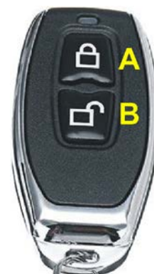
Tlačítka na vysílači