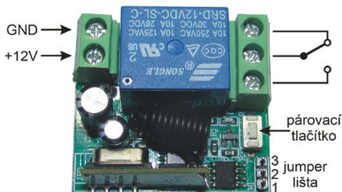
Popis zapojení modulu